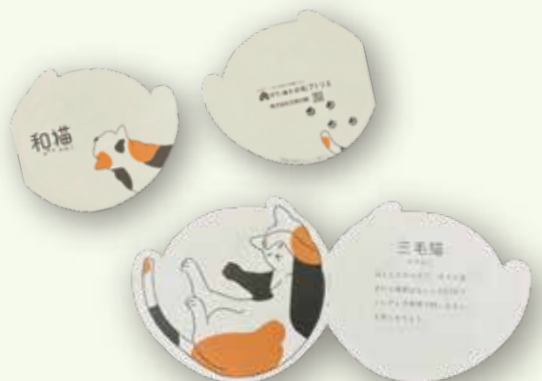
型抜き中綴じ冊子