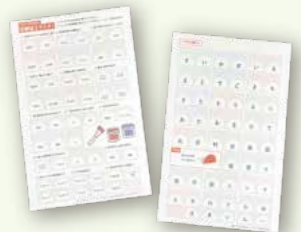
ビンゴdeアンケート