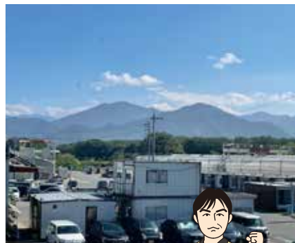
会社から見た菅平の山